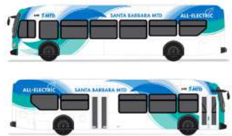
Autobuses eléctricos a batería de 40 pies