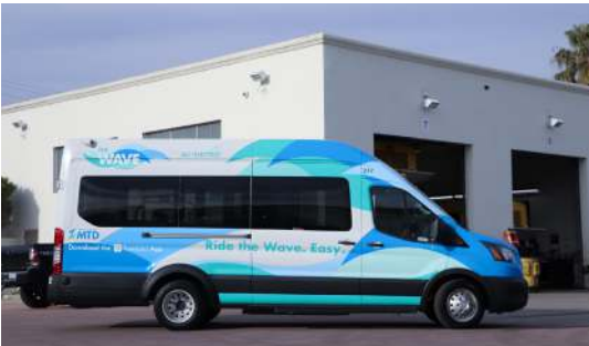
Furgonetas Ford Transit eléctricas a batería

A fines de 2021, se entregaron 3 nuevas Ford Transit Vans eléctricas a batería destinadas al piloto de microtransit de MTD. Estos vehículos operarán un servicio flexible, a pedido y de acera a acera dentro de un área específica de Goleta a medida que el piloto de microtránsito comience más adelante en 2022.