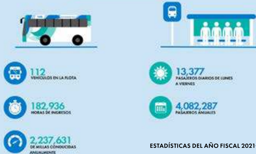
ESTADÍSTICAS DEL AÑO FISCAL 2021-22